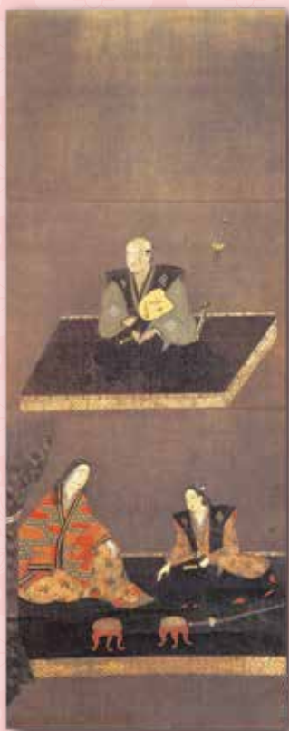
武田勝頼・妻子画像 (高野山持明院蔵) 展示期間4/9~5/6